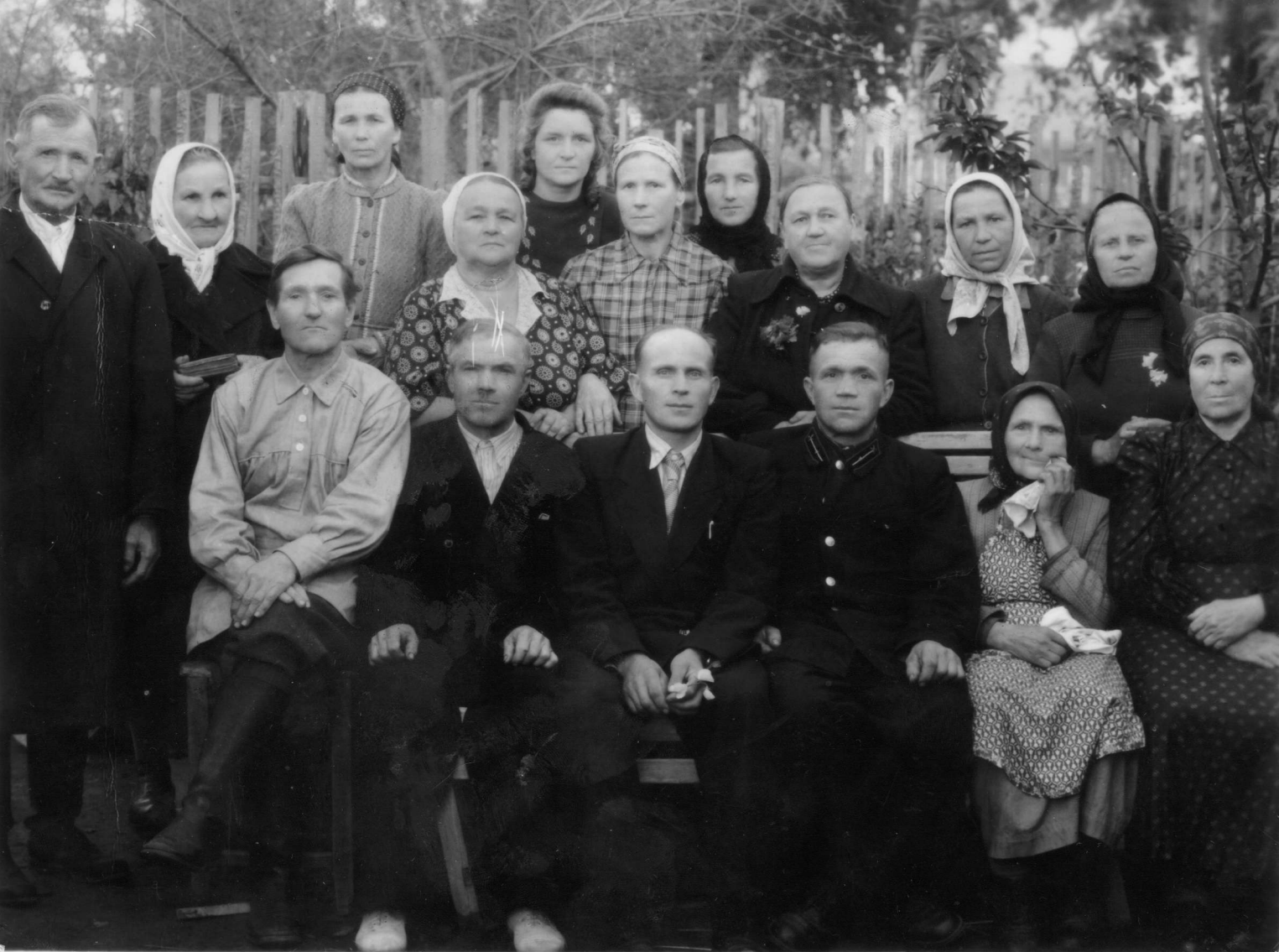
70-е годы XX в.