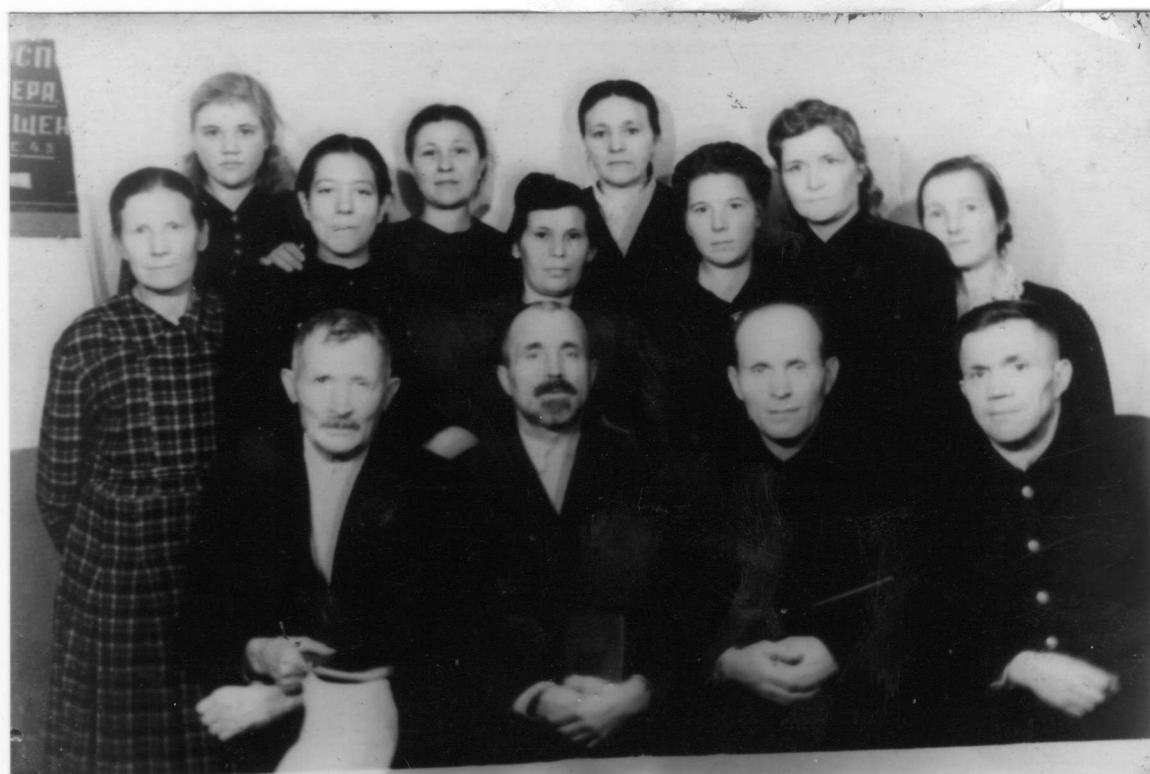
60-е годы XX в.