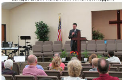
Рассказываю о служении в России в одной из церквей штата Техас.

Чтобы лучше ознакомиться с теорией и практикой своего труда, руководство миссии пригласило меня посетить свой главный офис в Техасе и создало для этого все условия. Мне нужно было только получить гостевую визу на въезд в США. Это было не так легко сделать, я имею виду необходимость доказать абсолютно чужому тебе человеку, что ты не собираешься грабить его страну и плохо себя там вести. До этого Американское Посольство мне уже дважды отказывало в выдаче визы, и я был весьма огорчен, когда мне было опять сказано "No", уже в третий раз, хотя у меня