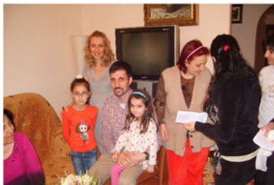
Во время проекта в Армении я стал свидетелем покаяния многих людей.

В августе этого года, после нескольких месяцев молитв и предварительных консультаций я присоединился к служению миссии «Международное Поручение». Эта миссионерская организация начала своё служение 40 лет назад по инициативе одного дьякона баптисткой церкви в штате Техас, и изначально оно было направлено только на благовестие в Мексике. Однако со временем Господь расширил пределы служения, и сейчас оно совершается в 153 странах мира. Но в эту миссию я вступил не из-за масштабов её служения, а из-за ориентированности её служения на поместные церкви. Думаю, что именно этого нам часто не хватало, когда шла речь о сотрудничестве наших церквей с зарубежными миссиями. Кроме того, я считаю, что организация подобных проектов межцерковного благовестия является лучшей формой для осуществления краткосрочных миссий в нашей стране.